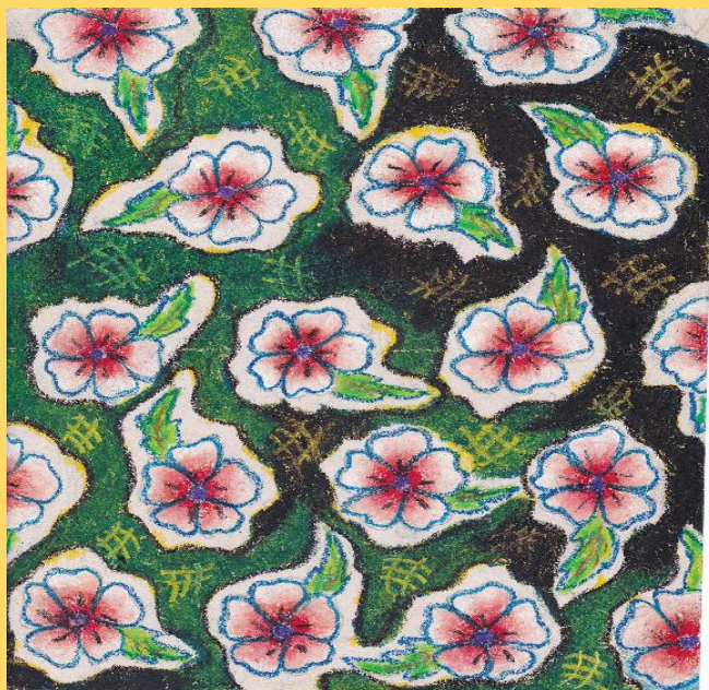
ඒ.එම්.හසිත සඳරුවන් ගුණවර්ධන