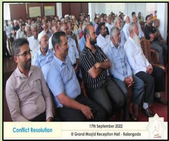
Conflict Resolution 17th September 2022 @ Grand Masjid Reception Hall - Balangoda