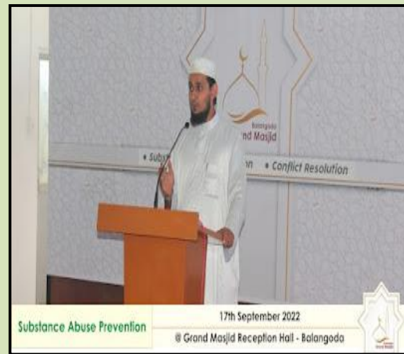
Substance Abuse Prevention 17th September 2022 @ Grand Masjid Reception Hall - Balangoda