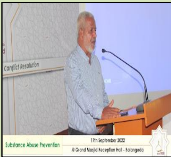
Substance Abuse Prevention 17th September 2022 @ Grand Masjid Reception Hall - Balangoda